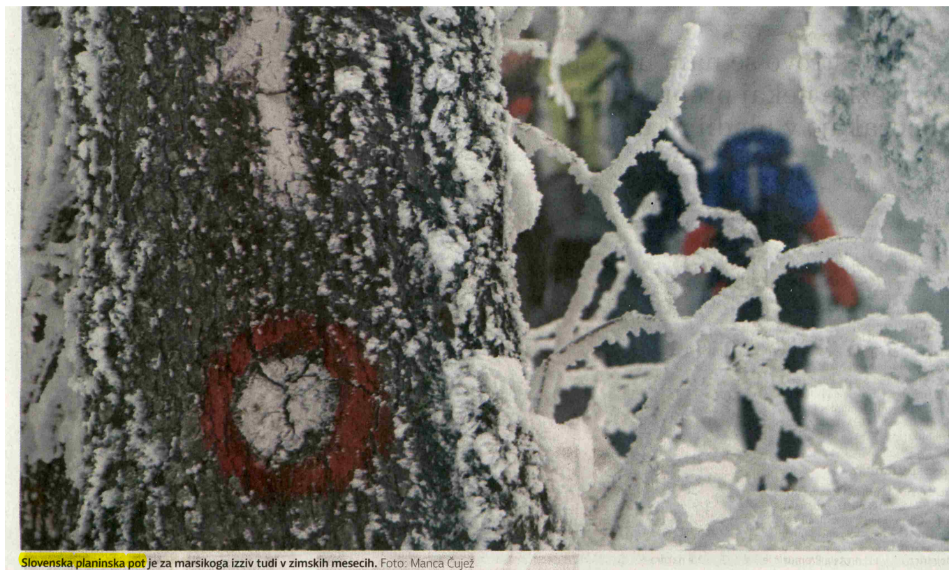
Slovenska planinska pot je za marsikoga izziv tudi v zimskih mesecih.